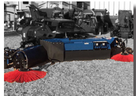
Cabezal de hileradora power-v